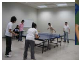
「球場無師生」（乒乓球比賽）