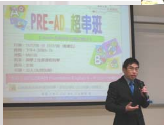
重新拼湊，從頭學起 （英文超級串字班）