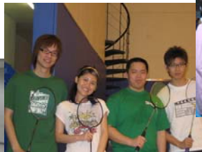
動作一致（羽毛球比賽）