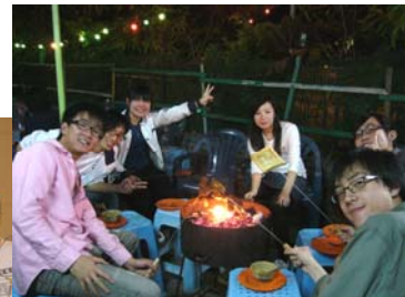
少不了勝利手勢 （燒烤晚會）