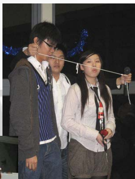
化腐朽為神奇（聖誕派對）