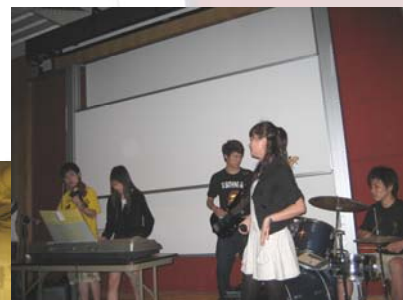
我有我天地（歌唱比賽）