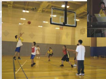
目標清晰（籃球比賽）