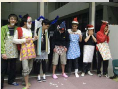
我們的聖誕老人（聖誕派對）