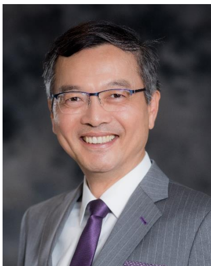
安老事務委員會主席 林正財醫生