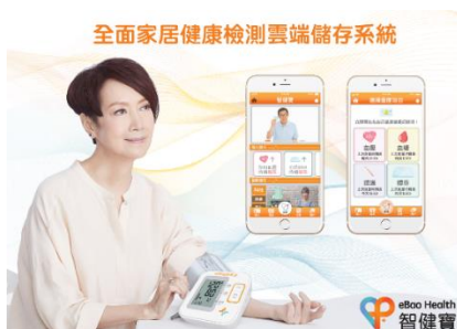
「eBao Health - 智健寶」 雲端健康管理平台