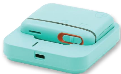
「智愛寶 iBao」 定位及防遊走管理服務

「榮華愛心科技服務有限公司」為本港一間社會企業，致力透過科技解決方案，公眾教育和支援服務回應「認知障礙症」及其照顧者的需要。透過進行研究開發，「榮華愛心科技服務有限公司」將創新科技和安老服務結合，從不同範疇將科技的便利融入生活。