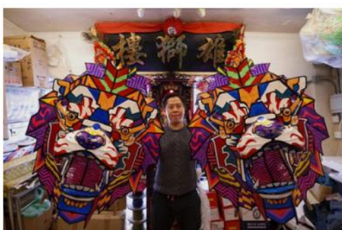
■ 融合藝術的紮作品 © 許嘉雄師傅

現在，雖然紮作師傅人數大幅下降，但部份師傅決定與時並進。有紮作師傅在傳統殯儀紙紮上，加入現代物品元素，成為新派紙紮；亦有紮作師傅和藝術家及商業品牌合作。