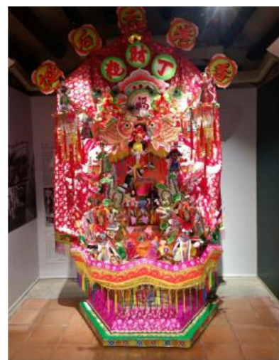
■ 花炮 ©冒卓祺師傅

紮作的紙祭品是傳統儀式法事的組成元素，以竹篾及紗紙製成。現今祭品多用於喪葬儀式中。