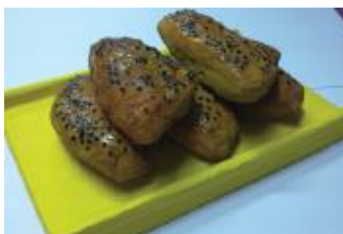
■ 與時並進、迎合潮流的紮作祭品。 © 歐陽秉志師傅